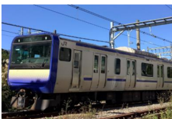
横須賀線 E235 系

※整理券の配布はございません。グリーン車の休憩スペースは、混雑状況によりお待ちいただく場合がございます。