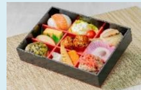
(HIGH RAIL 星空)特製弁当