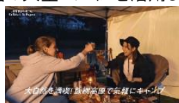
デジタルサイネージ(一部抜粋)