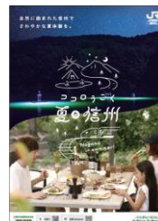
キャンペーンチラシ