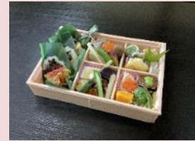
走る農家レストラン おいこっとふるさと御膳(ごはんあり)