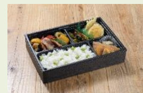
リゾートビューふるさと限定ランチ