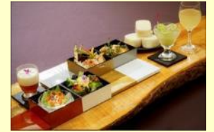
「更級の月」で楽しむ限定ディナーセット ※以前実施した際の写真です。 実際のメニューは写真と異なります。