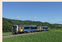
キハ E200 形