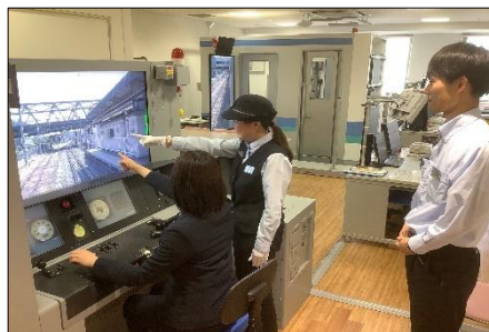
【現役乗務員が付き添いでレクチャー】