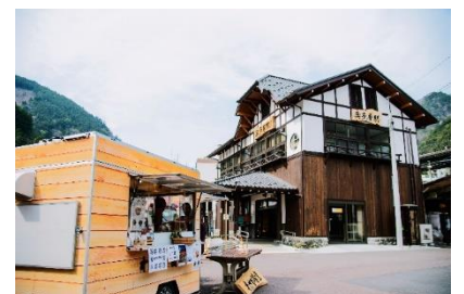
奥多摩駅前広場でキッチンカーを営業 ※営業日はわさび食堂 HP をご確認ください。