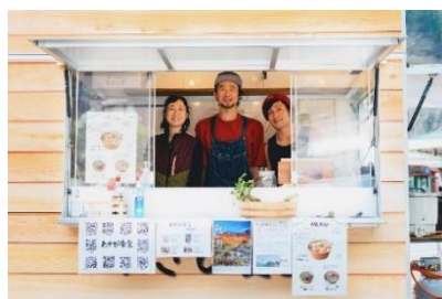
わさび食堂イメージ