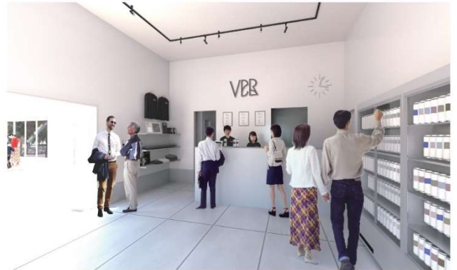
【NEW Bottle Shopイメージ】