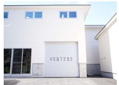
【会場イメージ・アクセス方法】