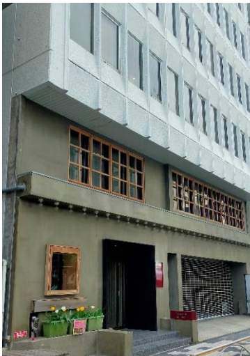
TokyoYard Building 外観

品川開発プロジェクトにおけるまちづくりの拠点として、既存ビルをリノベーションし、2020年4月より活用を開始しました。全フロアにプロジェクトメンバーオフィスや、会議やイベントを行えるスペース等を設け、実証実験、地域との交流、新しいサービスの創出を通じて、TAKANAWA GATEWAY CITYのまちびらきに向けた様々な情報発信を行っています。