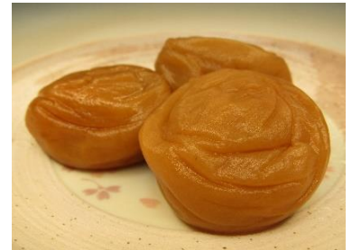
【紀州梅干し(和歌山県みなべ町)】