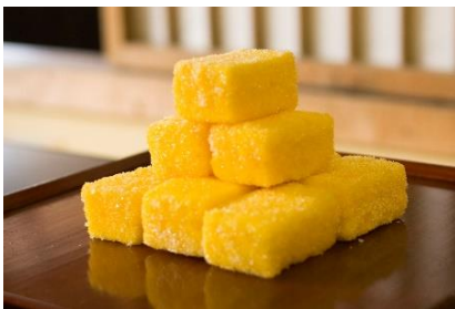
【カストース(長崎県平戸市)】