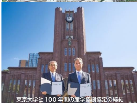
東京大学と100年間の産学協創協定の締結