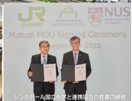
シンガポール国立大学と連携協力の覚書の締結