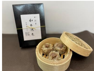
【かめま和牛焼売(栃木県鹿沼市)】