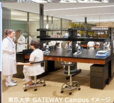
東京大学 GATEWAY Campus イメージ