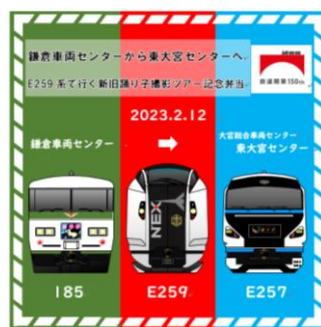
記念弁当のイメージ（内容は変更になる場合があります）