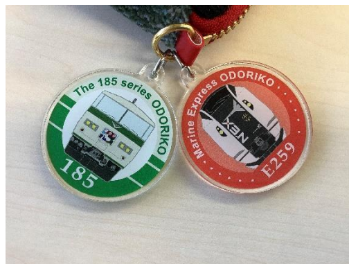
キーホルダーのイメージ