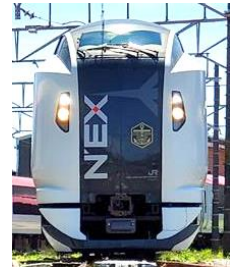
E259 系（マリンエクスプレス踊り子）