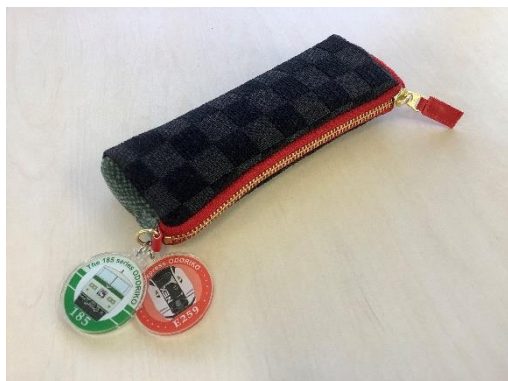
ペンケース本体のイメージ

185系とE259系の座席に使用されている生地を使用した特製ペンケースをお配りします。 また、本体には185系とE259系の前面デザインをあしらったキーホルダーを付属します。