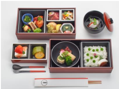
食事メニューの一例

創業は江戸末期の1846年。 175年もの間一流の味と風格を繋ぎ続け、 県外や海外の方にも広く親しまれています。