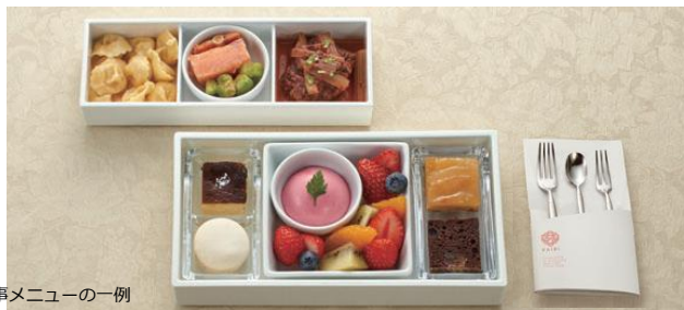
食事メニューの一例

※食事のおしながき等詳しくは専用パンフレット・二次元コードでご確認ください。 ※食事メニューは食材の仕入れ状況により変更となる場合があります。