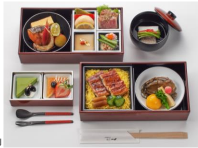
食事メニューの一例