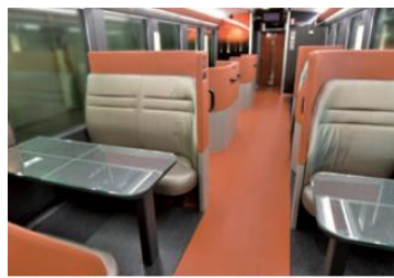
↑4人掛け(ボックス)シート 2人掛け(ベア)シート↑

※食事のおしながき等詳しくは専用パンフレット・二次元コードでご確認ください。 ※食事メニューは食材の仕入れ状況により変更となる場合があります。