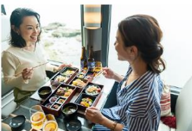
海里 4号車ダイニング (イメージ)

パッケージコード R27134101-00 03販売店様へ② 各種割引対象外 OP単独発売可