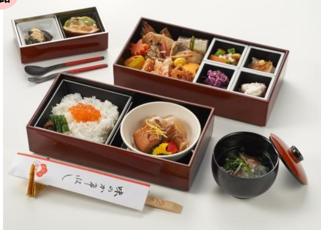
行形亭秋メニュー (イメージ)