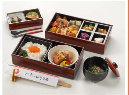
食事メニューの一例

創業は江戸中期の元禄の頃。 日本の古き良き伝統を守りながら、 季節ごとに厳選された日本料理を提供しています。