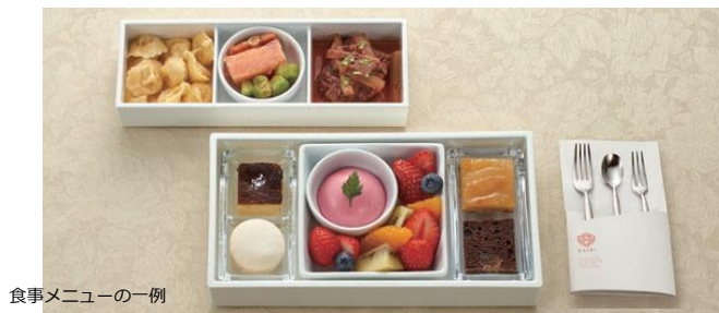
食事メニューの一例

※食事のおしながき等詳しくは専用パンフレット・二次元コードでご確認ください。 ※食事メニューは食材の仕入れ状況等により変更となる場合があります。