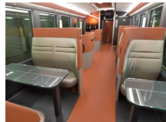
↑4人掛け(ボックス)シート 2人掛け(ペア)シート↑

※食事のおしながき等詳しくは専用パンフレット・二次元コードでご確認ください。 ※食事メニューは食材の仕入れ状況等により変更となる場合があります。