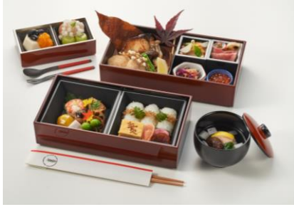
食事メニューの一例

創業は江戸末期の1846年。 175年もの間一流の味と風格を繋ぎ続け、 県外や海外の方にも広く親しまれています。