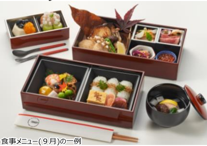
食事メニュー(9月)の一例

昔ながらの木造三階建ての主屋は、文化庁の有形文化財にも登録されており、創業は江戸末期(1846年)。175年もの間一流の味と風格を繋ぎ続け、県外や海外の方にも広く親しまれています。新潟の旬の食材を使ったメニューをご堪能ください。 ※7月は旬の食材を使った夏メニューを提供します。