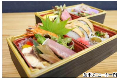
食事メニューの一例

食の都庄内親善大使 土岐正富氏監修の、庄内の豊富な食材を活かした特製弁当です。山形牛のローストビーフ、庄内浜紅えび入り豆腐かまぼこ、庄内沖旬魚の味噌粕漬、庄内浜である車エビやムール貝を使用し、アスパラは庄内産の金華豚で巻きました。庄内のおいしさがギュッと詰まった特製弁当をご賞味ください。