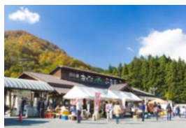
ぶな茶屋(そば・うどんコーナー)

開館時間/レストラン「あいあい」 11:30~14:00 ぶな茶屋(そば・うどんコーナー) 9:00~17:00 物産直売所 9:00~18:00