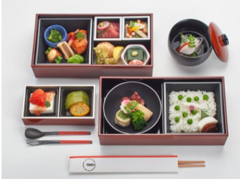
食事メニューの一例