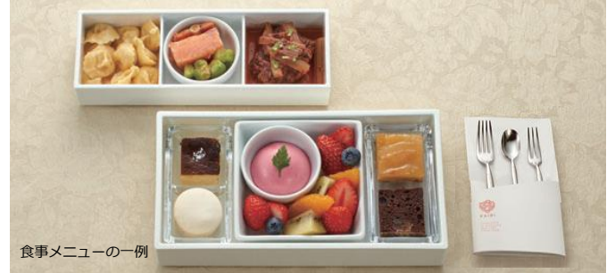
食事メニューの一例