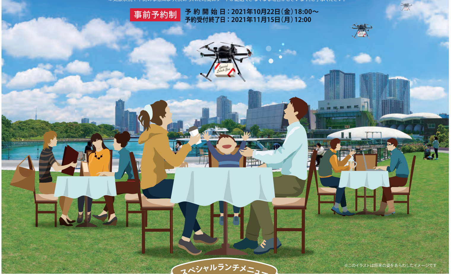
※このイラストは将来の姿をあらわしたイメージです

事前予約制 予約開始日：2021年10月22日(金) 18:00~ 予約受付終了日：2021年11月15日(月) 12:00