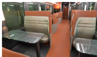
↑4人掛け(ボックス)シート 2人掛け(ベア)シート↑

※乗車後にアテンダントがお席にお伺いします。その際にドリンクのご希望をお伺いします。 ※アルコール類は、未成年のお客さまにはご提供いたしません。またご利用当日、車内で身分証明書等により年齢を確認させていただきます場合があります。 ※仕入れ等の都合により内容は変更となる場合があります。