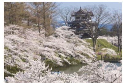
高田城址公園観桜会

販売店様へ 列車名「桜海里」。海里4号車は企画枠、予約時右記のJ Rコース選択をお選びください。【ベア】山側ベアシート:1、海側ベアシート:2、【ボックス】1または2または3(全て山側) 1回の操作での予約は各シート毎、複数のシートを予約する場合は顧客番号を分けて予約してください。枠外・手仕舞後の手配はできません。