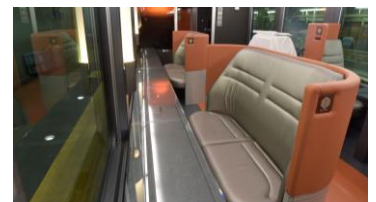
山側 2人掛け(ベア)シート