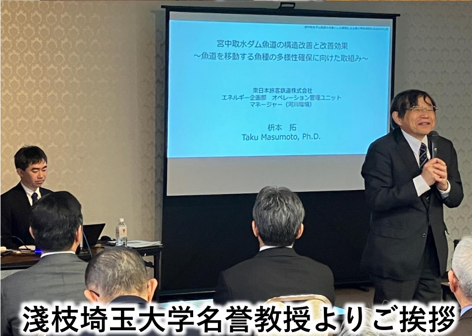
浅枝埼玉大学名誉教授よりご挨拶