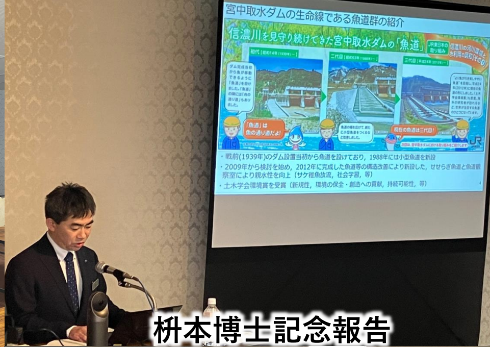
枡本博士記念報告